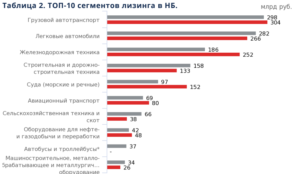
Таблица 2. ТОП-10 сегментов лизинга в НБ.

* статистика по сегменту ведется с 9М2020